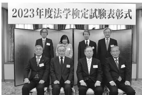
▲法学検定試験委員の先生方